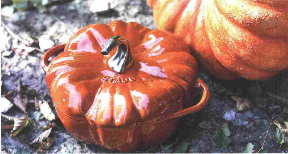
Gli Speciali di Staub: cocotte in ghisa dalle forme evocative