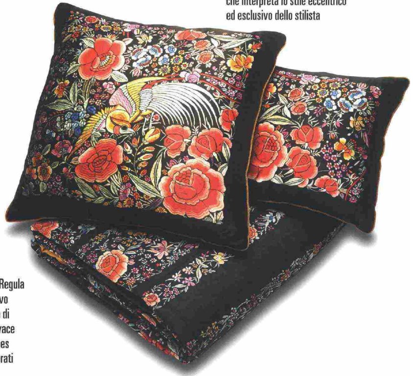
Enchanted Garden della collezione Roberto Cavalli Home Linen by Mirabello Carrara, all'insegna del glamour ispirato al "botanical style": una linea di biancheria che interpreta lo stile eccentrico ed esclusivo dello stilista